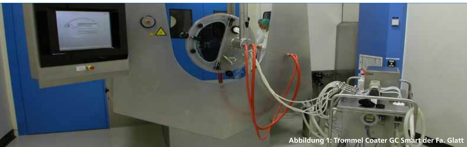
Abbildung 1: Trommel Coater GC Smart der Fa. Glatt

Durch hochqualifizierte Ingenieure und Techniker aus den unterschiedlichen Disziplinen (Verfahrenstechnik, Chemie oder Maschinenbau) mit jahrelangen Projekterfahrungen aus der pharmazeutischen Industrie, kann die weyer gruppe heute von der Planung über die Realisierung bis hin zur Inbetriebnahme und Qualifizierung das komplette Engineering im GMP-Umfeld abdecken. Mit dem Fokus auf die hohen regulatorischen Anforderungen in der pharmazeutischen Industrie legt die weyer gruppe bereits in der Planungsphase den Grundstein für eine erfolgreiche und wirtschaftliche Umsetzung der Kundenanforderungen sowie die Voraussetzung einer effektiven und konformen Durchführung der Qualifizierungs- und Validierungsaktivitäten gemäß den aktuellen Gesetzen und Richtlinien.